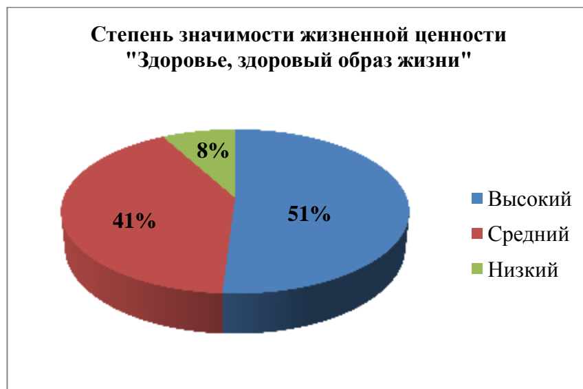
Рис. 7. Степень значимости жизненной ценности «Здоровье, здоровый образ жизни» у учащихся детских объединений МБУ ДО ЦТДМ АР.

У 10 учащихся (8 %) – низкая степень значимости ценности здоровья.